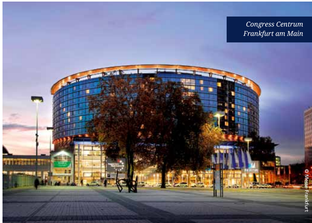
Congress Centrum Frankfurt am Main

Das Abschlussplenum des 20. DPT findet am Dienstag, 9. Juni 2015, in der Zeit von 15.15 bis 16.15 Uhr im Congress Center, Saal Harmonie, statt.