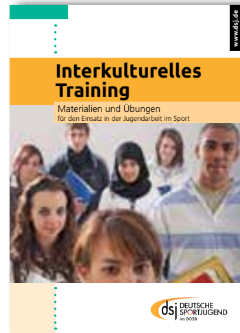
Interkulturelles Training – Materialien und Übungen für den Einsatz in der Jugendarbeit im Sport