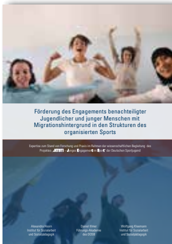
Expertise: Förderung des Engagements benachteiligter Jugendlicher und junger Menschen mit Migrationshintergrund