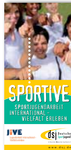
Flyer – Sportive Sportjugendarbeit international – Vielfalt erleben

Download oder Bestellung unter: www.dsj.de/publikationen