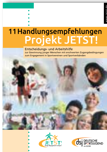
11 Handlungsempfehlungen zur Gewinnung junger Menschen mit erschwerten Zugangsbedingungen zum Engagement in Sportvereinen und Sportverbänden