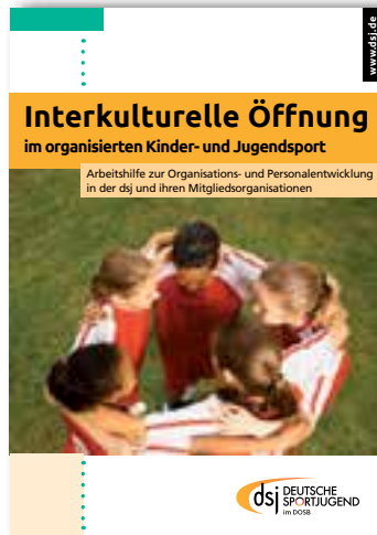
Interkulturelle Öffnung im organisierten Kinder- und Jugendsport