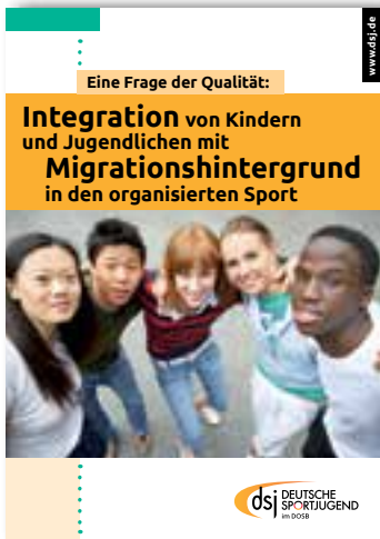
Eine Frage der Qualität: „Integration von Kindern und Jugendlichen mit Migrationshintergrund in den organisierten Sport“