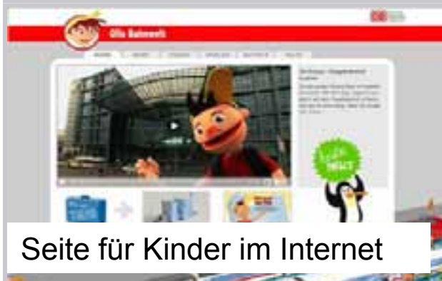
Seite für Kinder im Internet