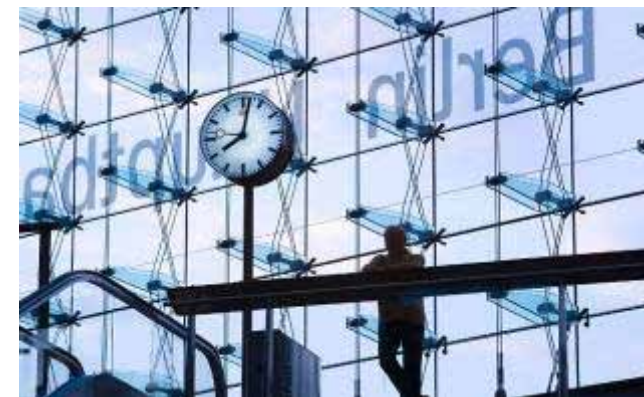
DB Netze Personenbahnhöfe