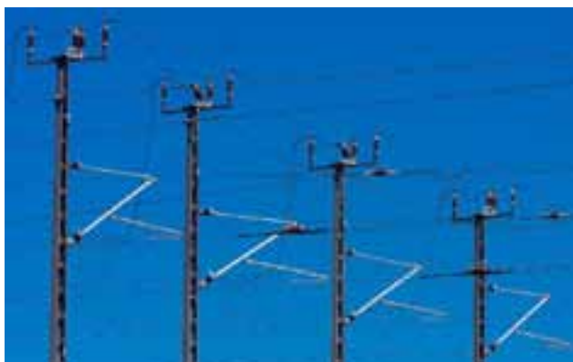
DB Netze Energie